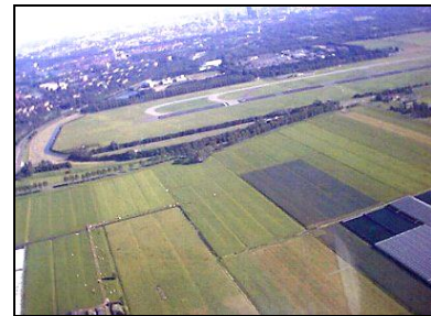
Right-hand base Rotterdam runway 06

De Toren kan ook opdracht geven om een: SHORT FIELD LANDING (een landing 'on the numbers') of een LONG FIELD LANDING (de touchdown op 2 e helft van de baan) te maken.